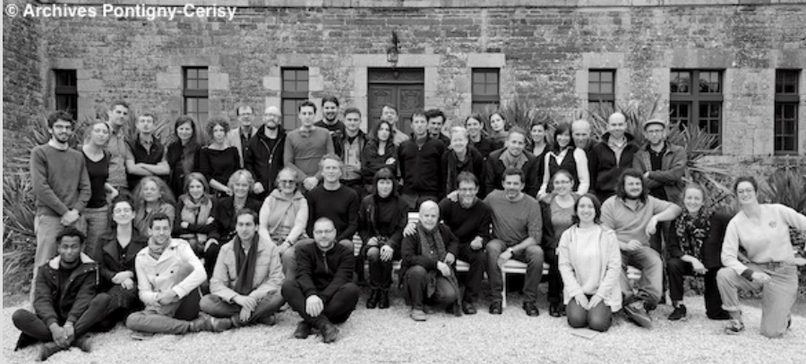
Photo de groupe du colloque Archéologie des media, écologies de l'attention (Cerisy, 2016)