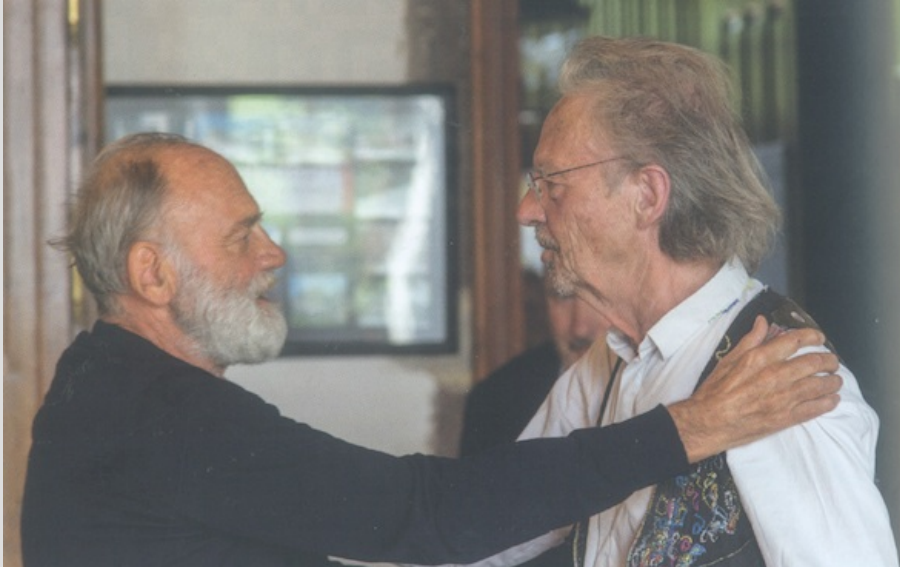
Bruno Ganz et Peter Handke, Cerisy, 2017

Bruno Ganz était à Cerisy en août 2017, au colloque " Peter Handke : analyse du temps ".