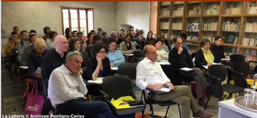
La Laiterie

Les inscriptions aux Colloques de Cerisy 2019 sont ouvertes. Notre brochure annuelle a été envoyée début mars aux membres de l'Association (à jour de cotisation 2018), aux partenaires, ainsi qu'aux contributeurs des vingt rencontres prévues. Les directeurs des colloques et l'équipe du CCIC œuvrent depuis plusieurs mois à l'établissement d'un programme dont, nous l'espérons, la richesse et la variété vous inciteront à venir nombreux à Cerisy. Nous vous remercions aussi de nous aider à diffuser largement l'information à partir de l'affichette ( en ligne ) ou des flyers à télécharger sur les pages de notre site internet présentant les différents colloques. Que toutes et tous soient ici remerciés de leur concours et de leur engagement !